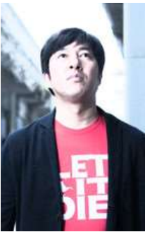
須田剛一/SUDA51 株式会社グラスホッパー・マニファクチュア 代表取締役/ゲームデザイナー

新着 PS5 Switch PS4 発売スケジュール ゲーム求人 ニュース ニュース 動画 特集・企画記事